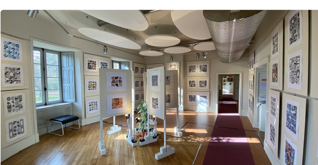
Exposition Marioline, 1ère salle de L'Hostellerie

Suite aux mesures gouvernementales, L'Hostellerie - Centre d'Art Singulier reste fermé jusqu'au 7 janvier .